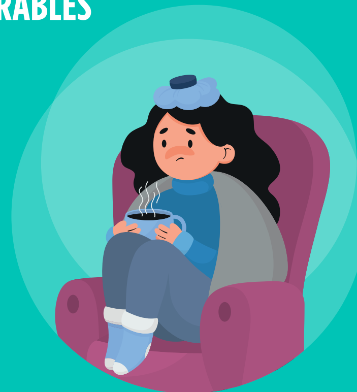
PERSONAS CON ENFERMEDADES

Enfermedades cardiacas o pulmonares o diabetes = mayor riesgo de complicaciones