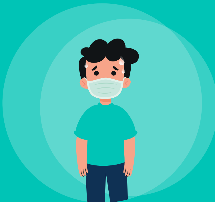
ALUMNOS CON ENFERMEDADES